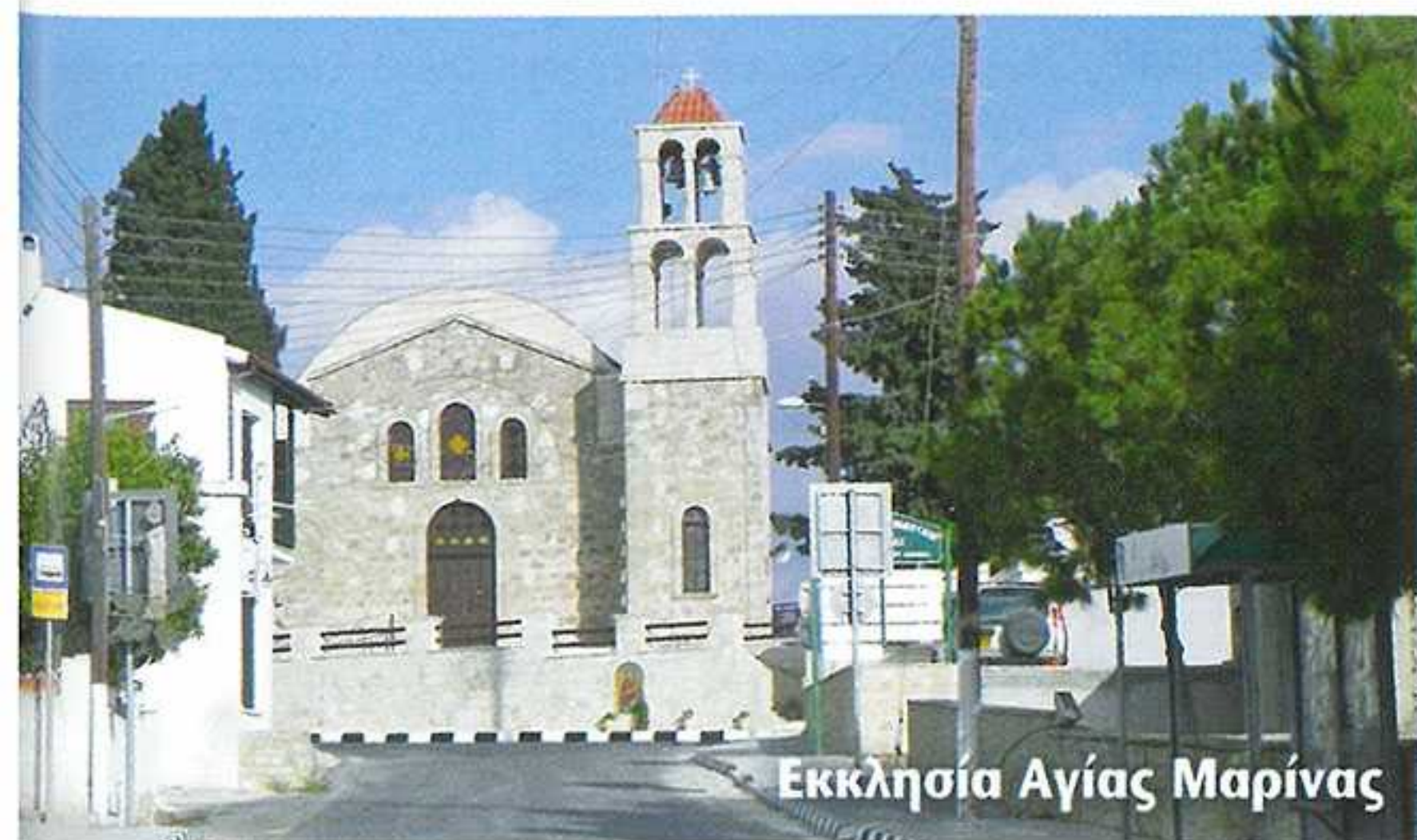
Εκκλησία Αγίας Μαρίας

Στην Αναρίτα το γαλάζιο της απέραντης θάλασσας «παντρεύεται» με την ομορφιά του φυσικού τοπίου. Η κοντινή απόσταση του από την πόλη της Πάφου, το φυσικό του περιβάλλον, η ηρεμία και η ομορφιά του αποτελούν παράγοντες επίσκεψης αλλά και μόνιμης κατοίκησης σε αυτό.