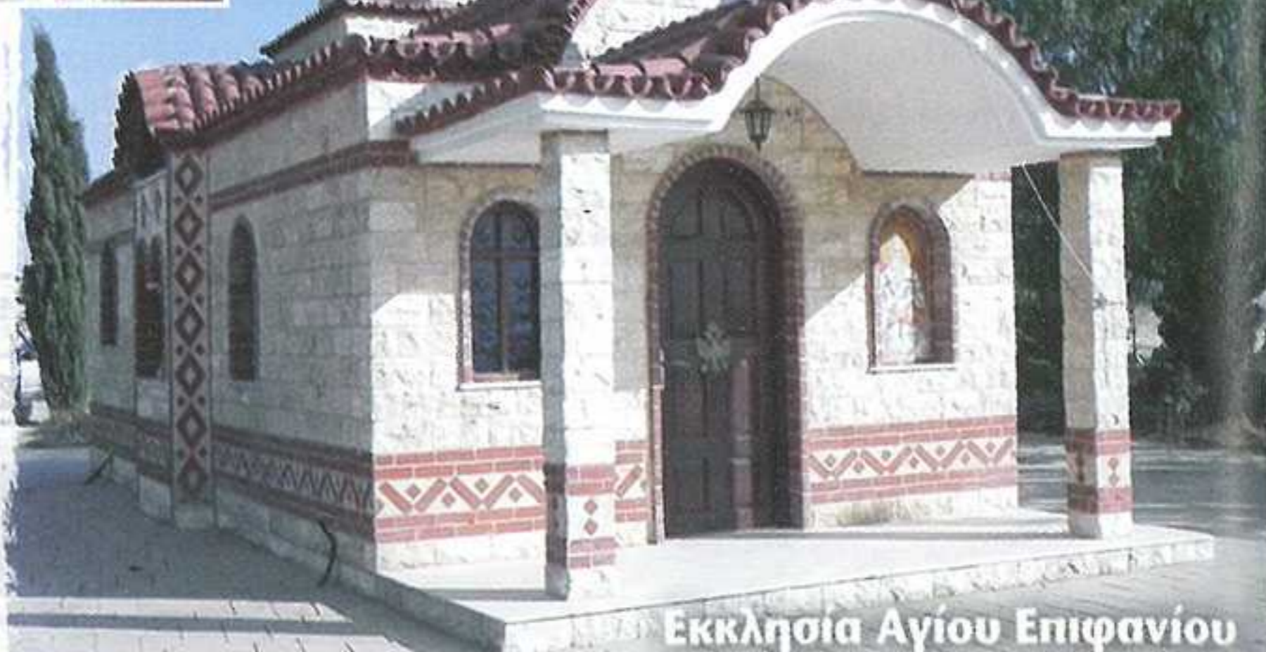
Εκκλησία Αγίου Επιφανίου

Κεντρική εκκλησία του χωριού είναι η εκκλησία της Αγίας Μαρίας, η οποία δεσπόζει στο κέντρο της κοινότητας. Είναι βυζαντινού ρυθμού, κτίσμα του 19ου αιώνα. Εσωτερικά η εκκλησία είναι απλή, ενώ πάνω από το ιερό βρίσκεται η μοναδική αγιογραφία με την παράσταση του Χριστού. Εξωτερικά είναι κτισμένη με πέτρα. Η εκκλησία έχει συντηρηθεί τα τελευταία χρόνια. Νότια του χωριού βρίσκεται η εκκλησία του Αγίου Ονησιφόρου, ο οποίος σύμφωνα με την παράδοση έζησε, ασκήτεψε και αγίασε στην περιοχή σε ένα σπήλαιο. Η εκκλησία αυτή είναι κτισμένη σε χώρο που παλαιότερα υπήρχε ομώνυμη εκκλησία, η οποία κατέρρευσε από σεισμό. Βρίσκεται δίπλα από το κοιμητήριο του χωριού. Η εκκλησία λειτουργείται μόνο δύο φορές το χρόνο, ανήμερα της γιορτής του Αγίου Ονησιφόρου, στις 18 Ιουλίου, και τη Δευτέρα της Λαμπρής. Στα ανατολικά του χωριού βρίσκουμε τη μικρή εκκλησία του Αγίου Επιφανίου, η οποία κτίστηκε το 2008 στο χώρο που ήταν τα ερείπια παλιού ομώνυμου ναού. Λειτουργείται μόνο τη 12η Μαΐου, ημέρα γιορτής του Αγίου.