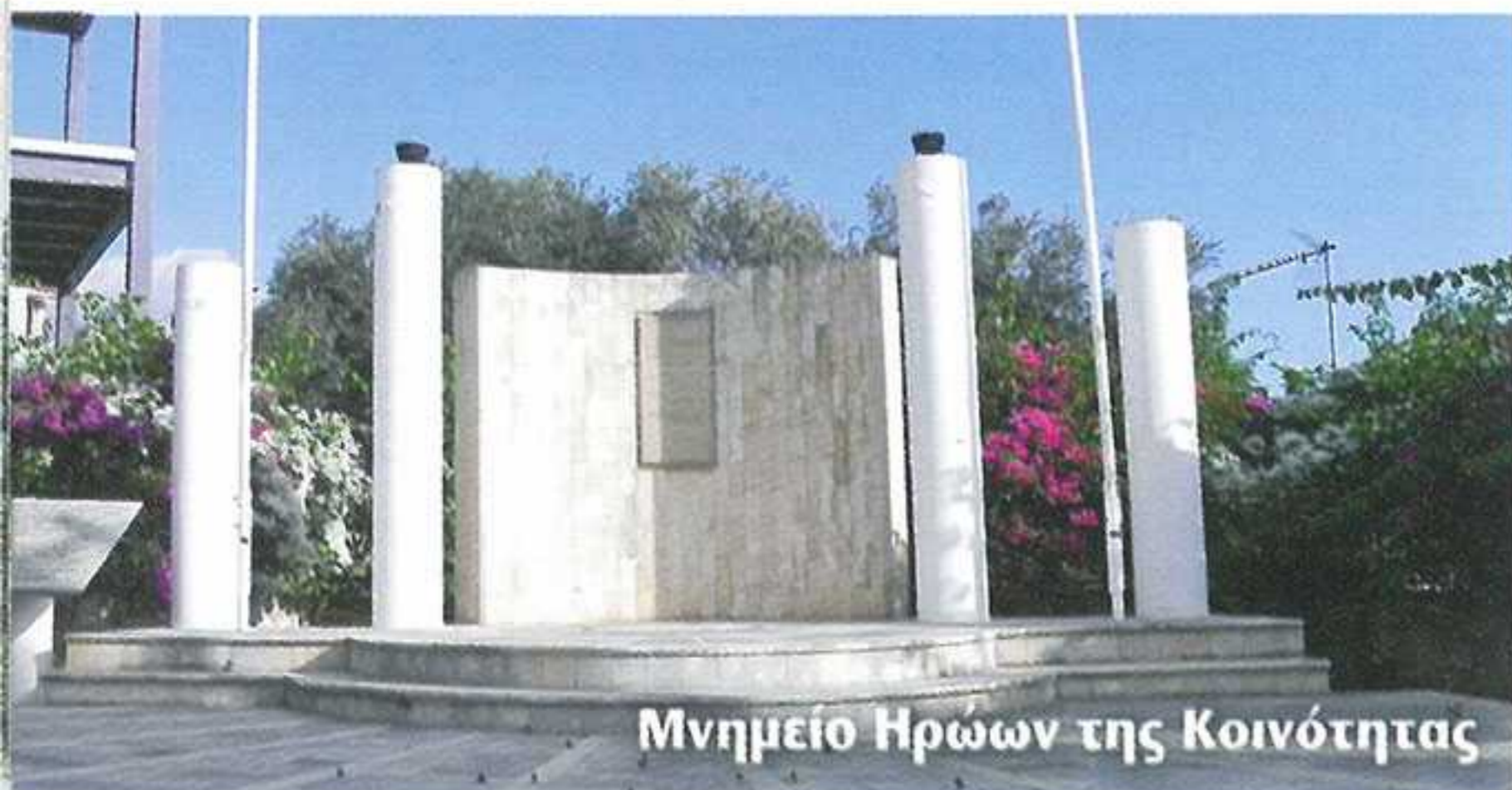
Μνημείο Ηρώων της Κοινότητας